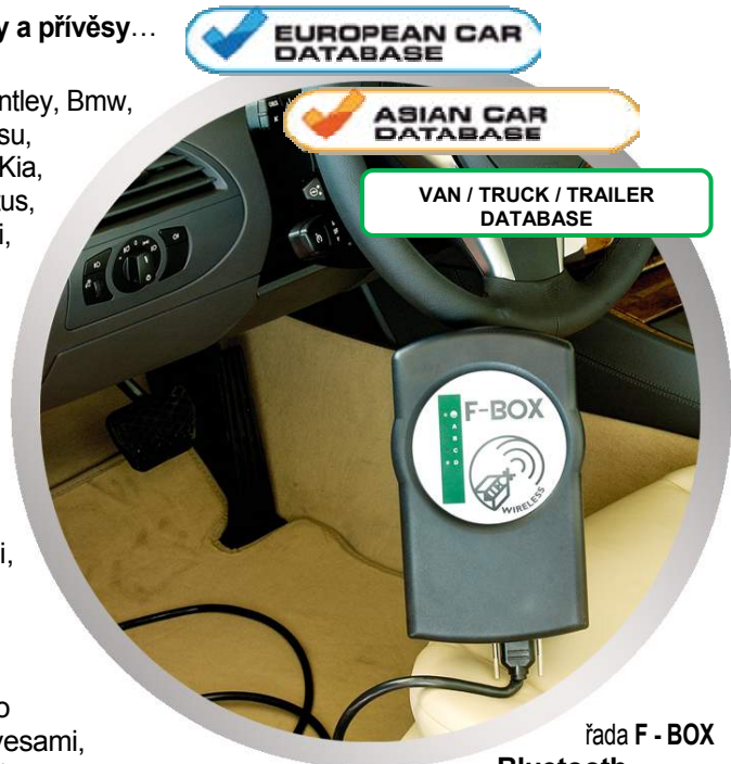
řada F - BOX s Bluetooth pro vozy CAR/VAN/TRUCK/BUS/TRAILER...