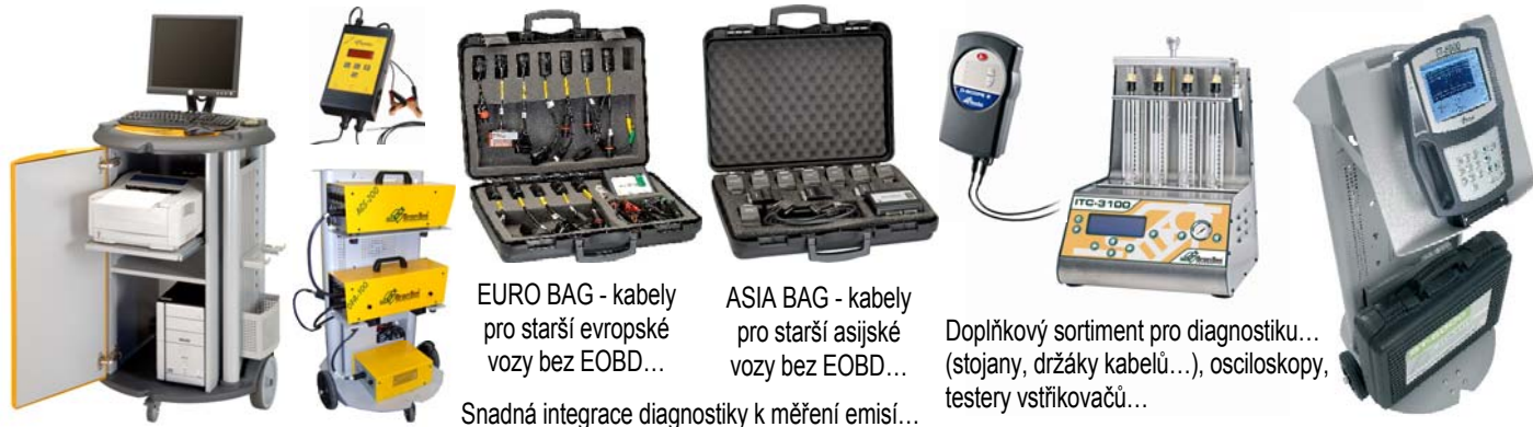
EURO BAG - kabely pro starší evropské vozy bez EOBD...