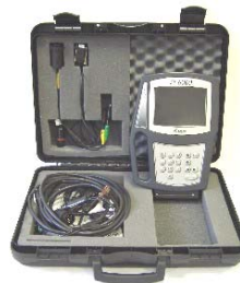
řada ST - 6000 LCD... pro vozy CAR / VAN / TRUCK, BUS / TRAILER...